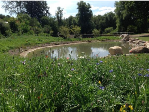
Sø i Mosegårdskvarteret, som opsamler og renses regnvand fra vejene før udledning til Nymosen

Også det trafikale har der været fokus på. Blandt andet har de nye regnbede en fartdæmpende effekt, og hastigheden er nedsat til 40 km/t på Mosegårdsvej og Toftekærvej.