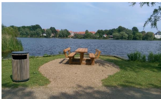
Et af de nye borde-bænkesæt ved Gentofte Sø.

Kommunens kirkegårde udgør et rekreativt mål for mange. Det gælder også ældre og borgere med handicap. Samtidig ligger flere af kirkegårdene centralt for bydelscentrene. Blandt andet derfor har Tilgængelighedsforum taget fat på at realisere en række tilgængelighedsforholdene på Ordrup Kirkegård er blevet forbedret i 2019.