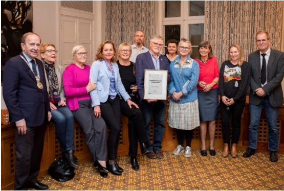
Repair Café Hellerups frivillige modtog Miljøprisen og de 25.000 kr.

Årets miljøpris og de medfølgende 25.000 kr gik denne gang til Repair Café Hellerup (tidligere Repair Café Gentofte). Repair Café Hellerup blev stiftet i 2018 af lokale frivillige og er et fællesskabsprojekt, som gør op med brug-og-smid-væk-kulturen. I stedet for at brugere går ud og køber nyt, når det gamle går i stykker, tilbyder de frivillige i reparationsværkstedet gratis at hjælpe med at reparere. På den måde får tingene forlænget deres levetid til glæde for både brugere og miljø. Reparationscafeen holder til i Byens Hus og har åbent 1. og 3. lørdag i måneden.