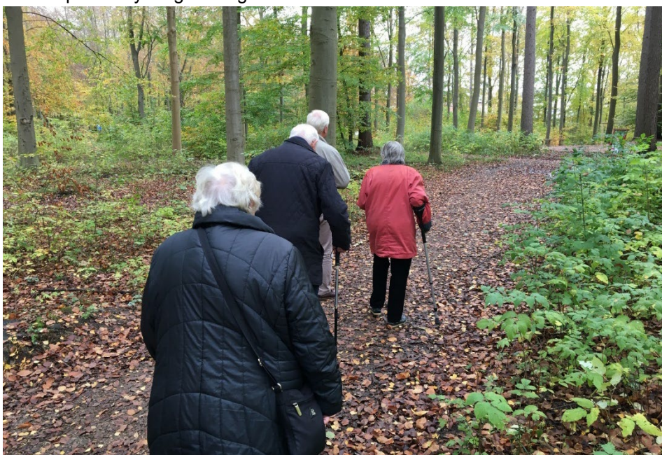
I efteråret var en række ældre på skovtur i Dyrehaven (Dagcenter Vennerslund, 2019)

Derudover har der i 2019 været arbejdet med udviklingen af det nye Jægersborghave. Medarbejdere og beboer-pårørende råd har blandt andet beskæftiget sig med rammerne for den fremtidige hverdag for beboerne på det ny Jægersborghave.