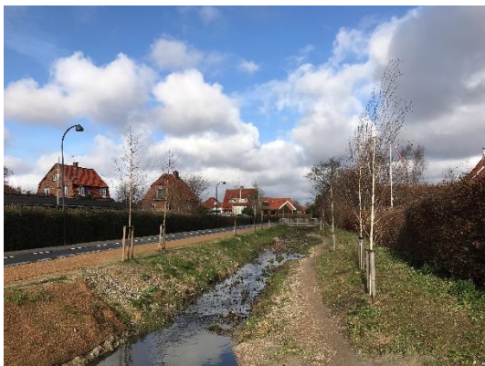
Gentofterenden nord for Snerlevej.

Der har været udført større afløbs- og klimatilpasningsprojekter i 2019, herunder Gentofterenden og Mosegårdskvarteret: