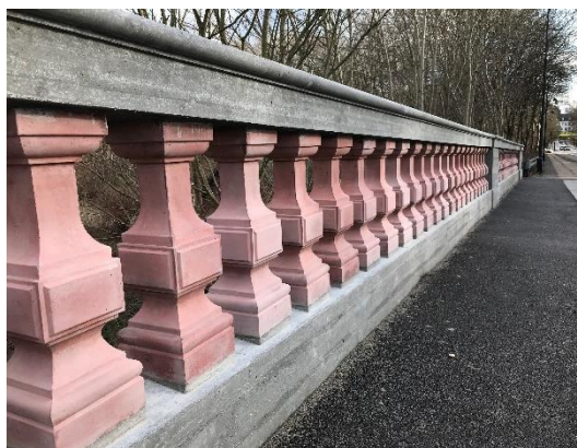
Nye balustre, håndlister og kantbjælker på broen, hvor Jægersborg Allé krydser S- og regionaltogbanen ved Charlottenlund Station.

Trafiksikkerhedsplan 2017-2020 er udarbejdet i opgaveudvalget "Trafik – Sikker i byen" og blev vedtaget af Kommunalbestyrelsen i maj 2016. Sammen med borgere fra opgaveudvalget blev der i 2017 arbejdet med at konkretisere initiativer, som skal realisere den vedtagne trafiksikkerhedsplan, og i den forbindelse udarbejdet en handleplan, som prioriterer arbejdet fra 2017 til 2020.