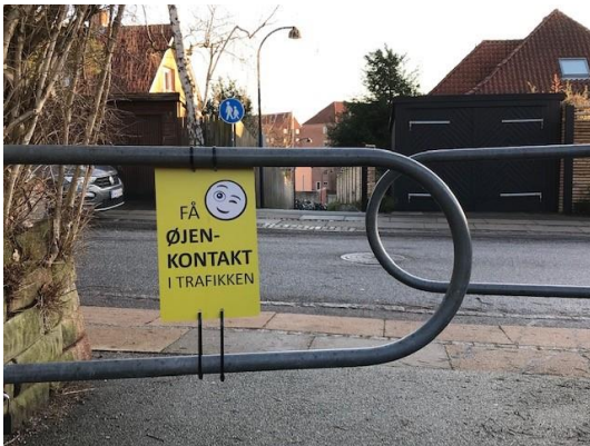
Skilt fra kampagnen "Få øjenkontakt i trafikken" ved Nonnestien, som blandt andet bruges af skoleeleverne på Sankt Joseph Søstrenes Skole.

Udmøntningen af initiativerne sker i tæt samarbejde mellem de berørte parter, så der tilvejebringes helhedsorienterede løsninger. Skoler, institutioner, grundejerforeninger, handelsstandsforening, seniorråd, handicap-råd, Rådet for Sikker Trafik og ikke mindst den enkelte borger er vigtige aktører i arbejdet med at opnå de ønskede ændringer i trafikadfærden.